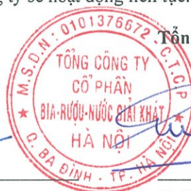
Ngô Quế Lâm